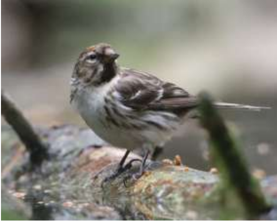
Gråsiken – hun