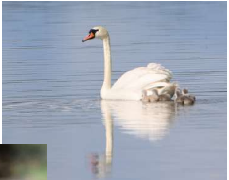
Knopsvane med unger