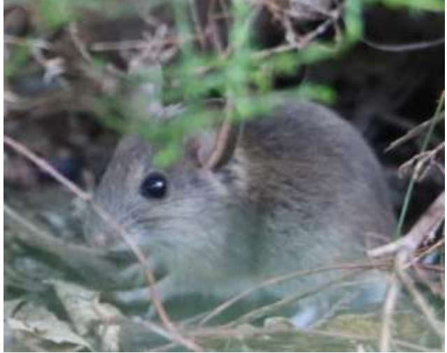
Egern på foderbrættet - skovmus og rødms under foderbrættet.