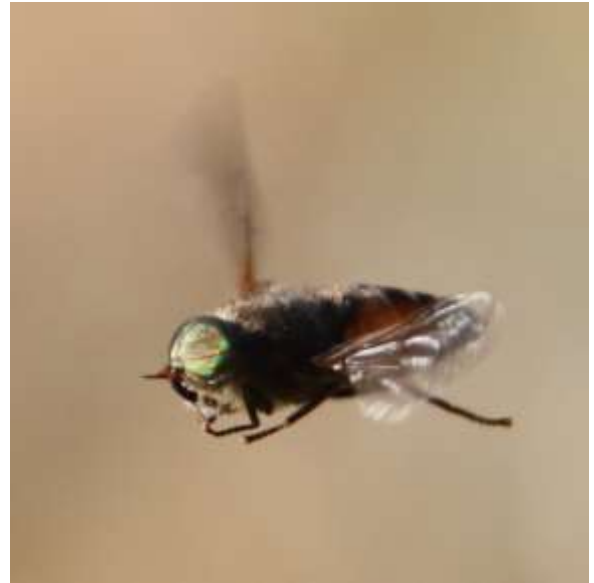
Klæg taget i flugten på engen - Hybomitra kaurii