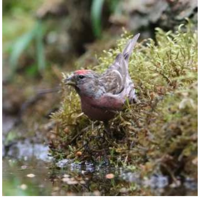
Gråsiken - han