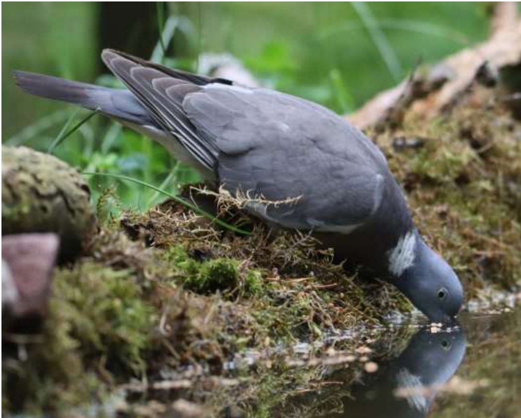
Solsort og Ringdue ved fotoskjul