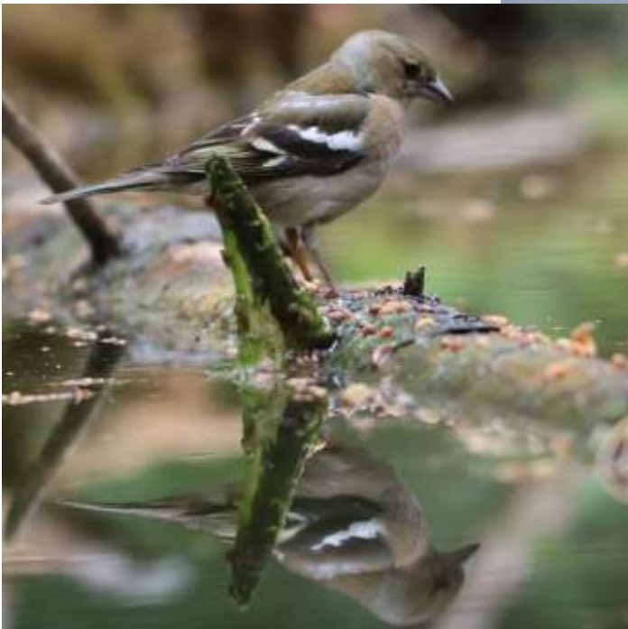
Bogfinke – hun

(og det er Ikke en kvinde med hang til bøger)