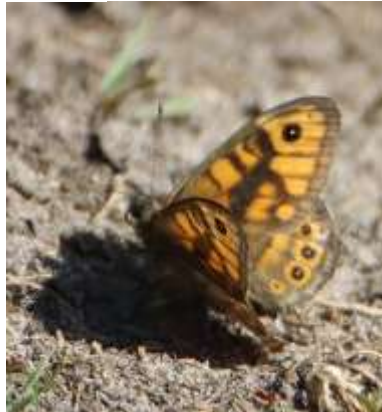
Vejrandøje, set ved Jernhatten