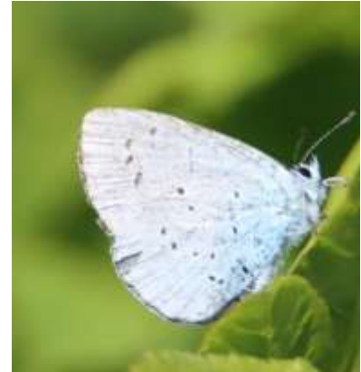
Skovblåfugl, set ved Jernhatten