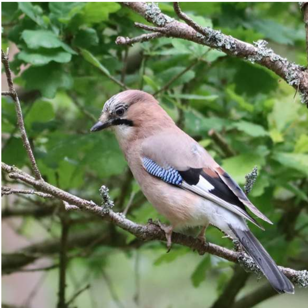
Skovskade, musvit og blåmejse "skudt" fra fotoskjul