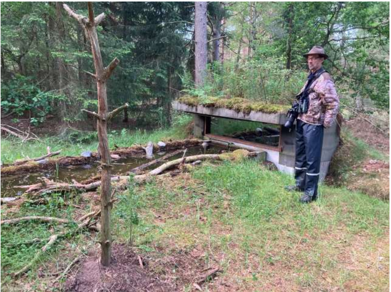
Fotoskjulet er solidt bygget (godt håndværk) og gav fine fotos af arter, som ellers kan være svære at komme nær.