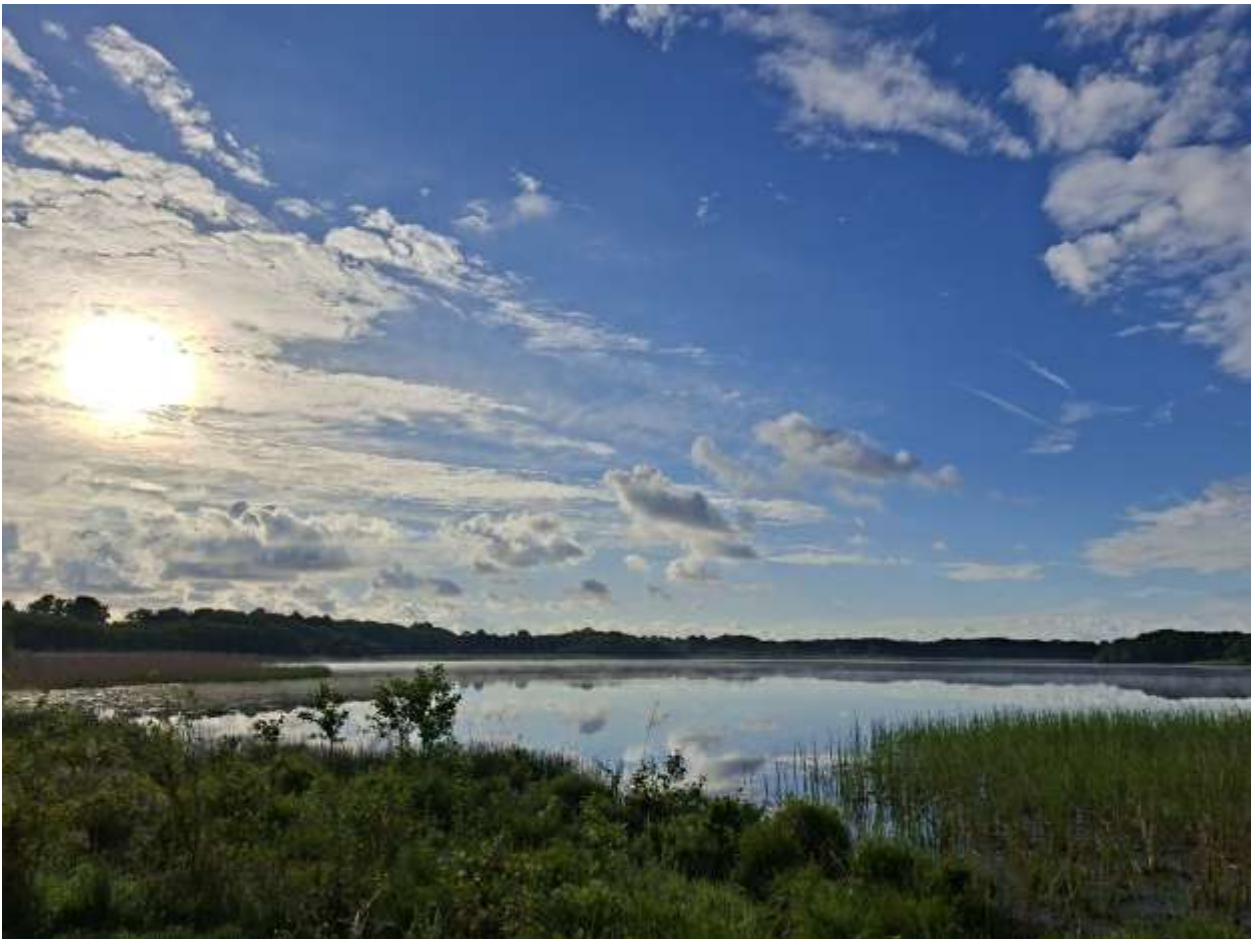
Stubb Sø. Her var Knopsvane, Gråand, Grågæs, Bramgæs, Canadagæs, Skarv, Blishøne og Fiskehejre, men til vores overraskelse ikke Toppet Lappedykker, Vandrikse, Rørhøne eller Sivsanger.