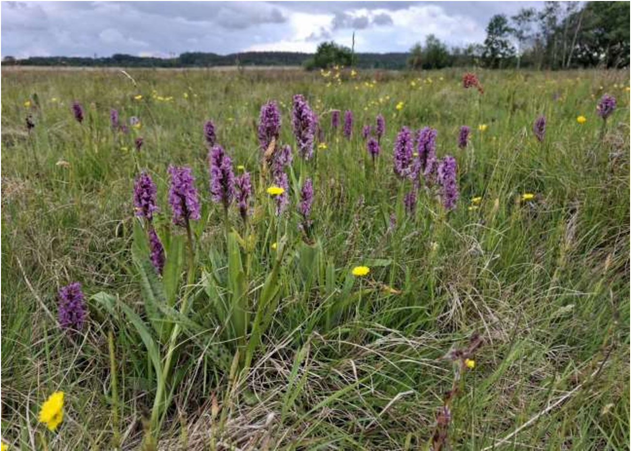
Majgøgeurt på engen