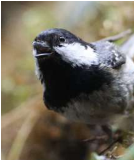
Sortmejse ved fotoskjulets rude