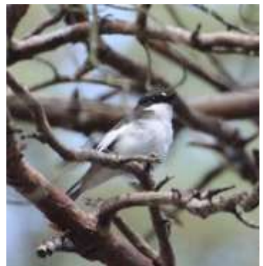
Fugleværnsfondens areal ved Stubbe Sø har Danmarks tætteste bestand af Broget Fluesnapper