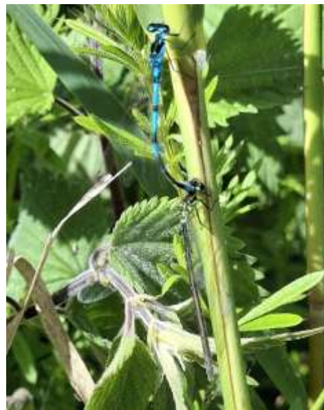
Hestesko-vandnymfer i tandem