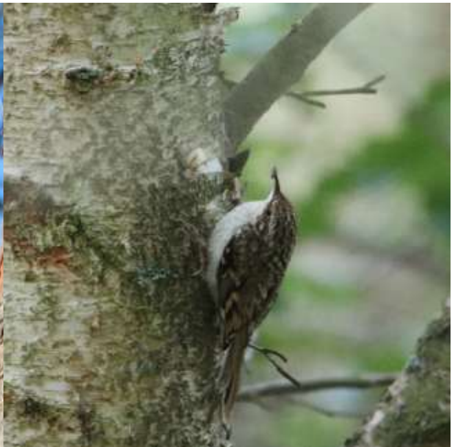
Træløber der har fundet et insekt