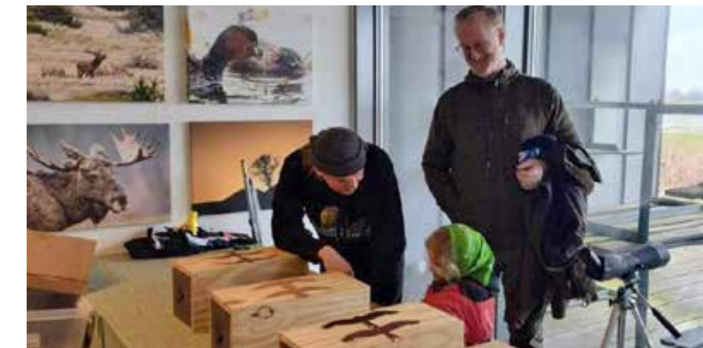
Ørnens Dag 2024 i Lille Vildmosecentret.

stod tomme. Vi ønskede desuden at afholde et efterårsarrangement for nye medlemmer, men måtte aflyse på grund af lav tilmelding. Endelig måtte vi opgive at arrangere et juleevent, da vi ikke havde tilstrækkeligt med frivillige.