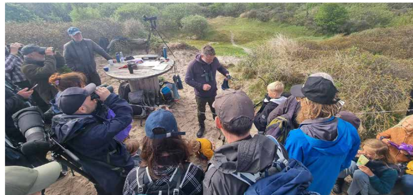
Ringmærkning ved Kabeltromlen med Ørneklubben til Skagen Fuglefestival.