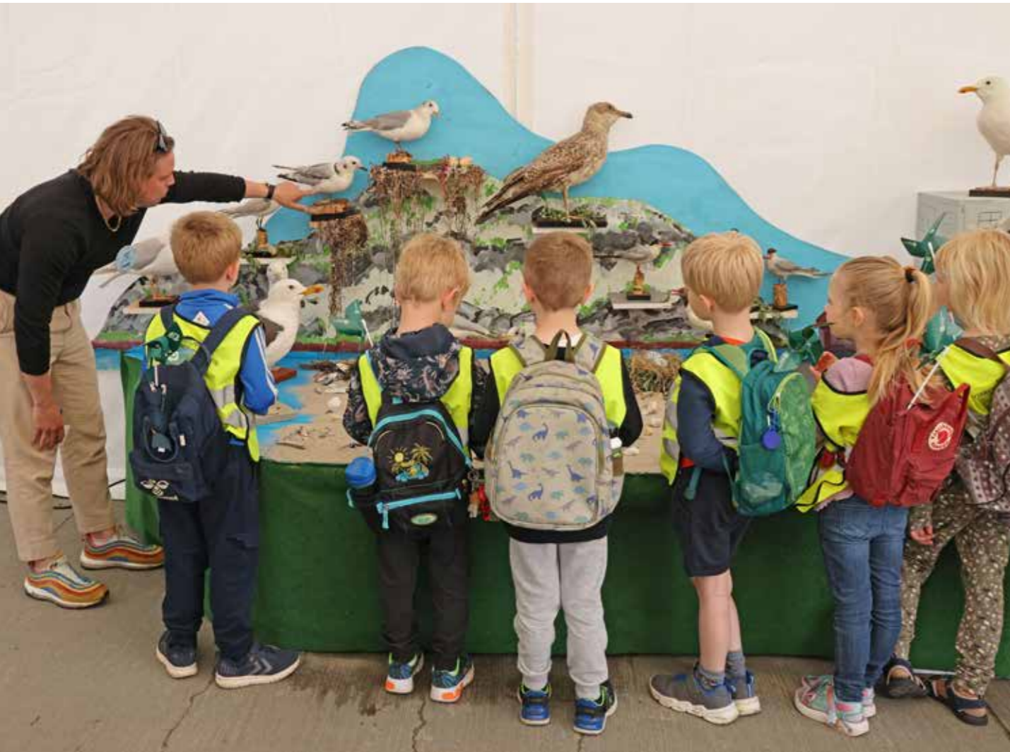
Ørneklubben formidler i teltet på Naturmødet 2024.