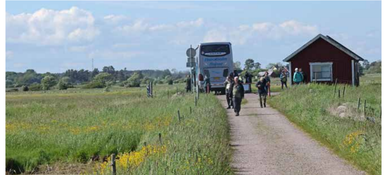
På fugletur til Øland.

Året startede med en nytårskur hos Anders Jørgen og Ulla den 4. januar. Det var vores tredje nytårskur, så det er blevet en fast, festlig og hyggelig tradition.